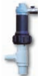
корпус из PP