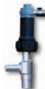
корпус из Aisi 316

Все приведенные значения являются приблизительными и ориентировочными.