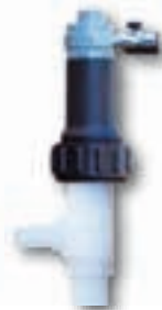
корпус из PVDF